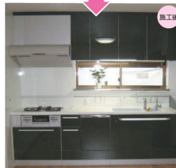
1Fキッチン(トクラス ベリー)