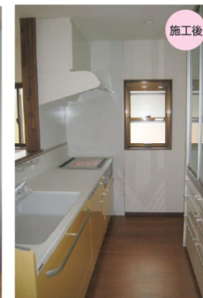
2Fキッチン(トクラス ベリー)