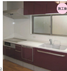
1Fキッチン(トクラス Bb)

収納力がアップしたことで、使いやすくなり、キッチンに立つのが楽しみになりました。来客の方に「きれいになって良くなったね」と言われるのですごくうれしいです。コープハウジングさんにリフォームして頂いて良かったです。