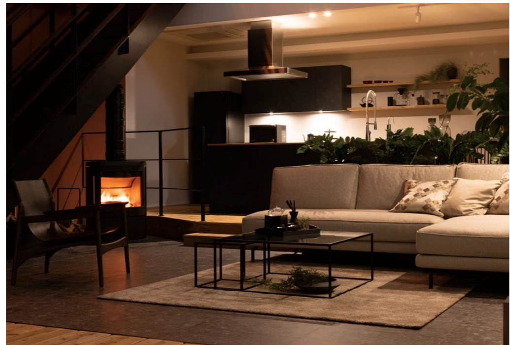
薪ストーブのぬくもりに包まれながら絶品コーヒーと洋菓子をご賞味ください。

予約特典 QUOカード 500円分 ※2月2日(金)までのご予約が対象。 ※一組様一枚まで